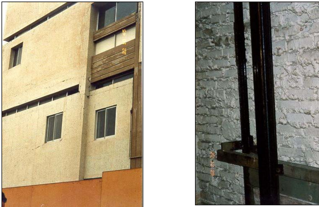
Figura 11. Daños en el Hospital Juan Noé Crevani de Arica: muros de fachada fisurados (izq.) y ascensor fuera de servicio (der.)

El hospital Juan Noé Crevani de la ciudad de Arica comprende un edificio de seis pisos que tuvo importantes daños en tabiques y servicios a raíz del sismo de junio 2001. Su estructura está conformada por pórticos de concreto armado más las cajas de ascensores y escaleras (que son muros de albañilería), con excesiva flexibilidad lateral. El edificio fue construido hace más de 30 años y por su cercanía al mar ya tenía problemas de corrosión en las armaduras de columnas. Esta circunstancia ya hubiera ameritado la ejecución de un proyecto de reforzamiento. El sismo ha venido a agravar el estado de la edificación, por la fisuración de una gran cantidad de tabiques, especialmente en las fachadas, y la falta de operatividad de los ascensores producto de la deformación ocurrida en los rieles apoyados en muros de albañilería (fig. 11).