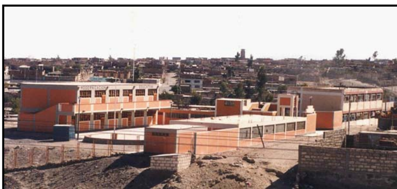
Figura 2. Centro Educativo Casimiro Cuadros en Arequipa.

En este centro educativo, el sismo del 2001 debió mover la cimentación de todos los bloques de manera parecida; sin embargo, cada pabellón tuvo un comportamiento distinto. Los pabellones tradicionales con sistemas de pórticos flexibles, tuvieron fallas de columna corta. En uno de estos pabellones, la mala calidad de la construcción agudizó el problema a tal extremo que se decidió su demolición (Figura 3). En cambio, el pabellón rígido, construido con los criterios de la Norma Sismorresistente de 1997, no presentó daño.