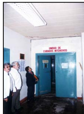
Figura 10. Daños en instalaciones sanitarias en el Hospital Hipólito Unanue de Tacna.