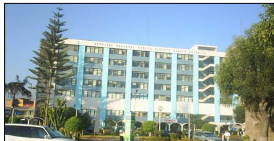
Figura 17. Reforzamiento sísmico del edificio del hospital de 7 pisos en 2003 (izq.) y 2005 (der.).