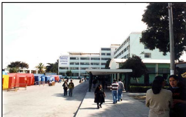
Figura 9. Hospital Hipólito Unanue de Tacna con daño en tabiquería, se desalojó los pisos superiores.

En el Hospital Hipólito Unanue en Tacna (Figura 9), además de los daños en la tabiquería, se produjeron daños en las redes de agua y desagüe (Figura 10). Se desalojaron todos los pisos superiores del edificio más alto y se improvisaron instalaciones de emergencia.