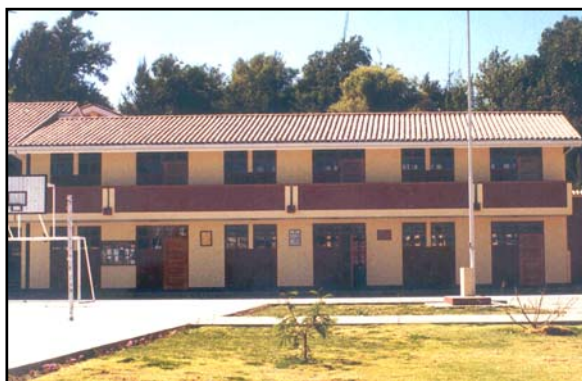
Figura 6. Edificios educativos modernos construidos con la Norma de 1997, sin daños