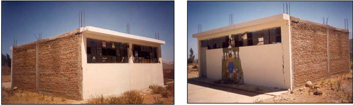
Figura 4. Falla por columna corta en ambos ejes longitudinales de centro educativo, Arequipa 2001.

Lo que se encontró en el Colegio “Casimiro Cuadros” es un buen ejemplo de lo observado en otros centros educativos de la zona afectada: pabellones con daños por problemas de columna corta formados por pórticos flexibles de concreto armado en la dirección longitudinal; por otro lado, pabellones sin daños formados por pórticos robustos de concreto armado en la dirección longitudinal. En la dirección transversal usualmente se tienen muros de albañilería sin daños; sin embargo, sí se notaron daños cuando en algunos casos la estructura en esta dirección está formada por pórticos de concreto armado rellenos de albañilería (tabique no portante). La fig. 4 ilustra el caso de una edificación de un piso con columna corta en ambos ejes longitudinales.