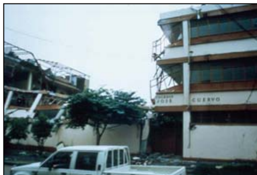
Figura 18. Edificios educativos con daño severo en Cariaco, Venezuela 1997 (izq.) y en Armenia, Colombia 1999 (der.).