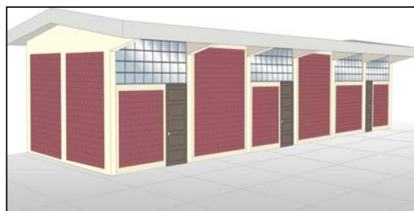
Figura 13 Sistema de Reforzamiento para edificios de un piso

Los edificios de dos a cuatro pisos se reforzaron incorporando muros de concreto y vigas de acoplamiento. Los muros de concreto generalmente se construyeron incorporando a las columnas existentes; las vigas de acoplamiento, de peralte importante, se dispusieron sobre las losas de cada piso. Las figuras 14 y 15 muestran el esquema de reforzamiento para un edificio de dos niveles.