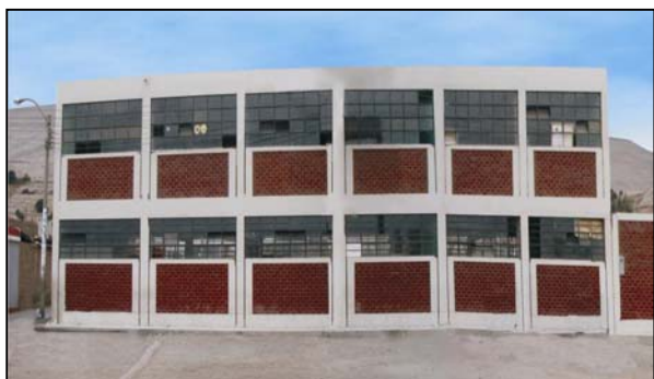
Figura 14. Edificio de dos pisos antes del reforzamiento.

Los edificios de dos a cuatro pisos se reforzaron incorporando muros de concreto y vigas de acoplamiento. Los muros de concreto generalmente se construyeron incorporando a las columnas existentes; las vigas de acoplamiento, de peralte importante, se dispusieron sobre las losas de cada piso. Las figuras 14 y 15 muestran el esquema de reforzamiento para un edificio de dos niveles.