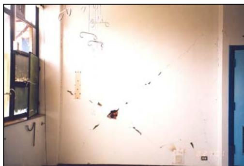
Figura 7. Hospital en Arequipa-Edif. de 7 pisos Figura 8. Tabiques dañados en Hospital

En el Hospital Hipólito Unanue en Tacna (Figura 9), además de los daños en la tabiquería, se produjeron daños en las redes de agua y desagüe (Figura 10). Se desalojaron todos los pisos superiores del edificio más alto y se improvisaron instalaciones de emergencia.