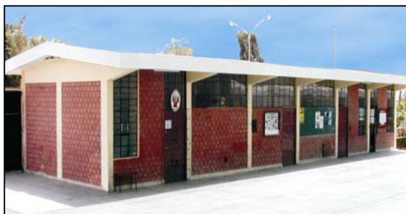
Figura 12. Edificio de un piso antes de la intervención

Para edificaciones de un piso se optó por incorporar muros de albañilería en la dirección longitudinal, debidamente confinados por las columnas reforzadas de los pórticos existentes y por vigas nuevas en el techo. Las figuras 12 y 13 ilustran el sistema de reforzamiento típico empleado.