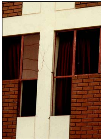
Figura 5. Daño típico de columna corta en edificios de la Universidad Nacional San Agustín de Arequipa.

En la Universidad Nacional San Agustín de Arequipa, los daños también se debieron a la excesiva flexibilidad de los edificios, lo que ocasionó la falla de columna corta en muchos pabellones. En el pabellón de Ingeniería Electrónica se había tratado de evitar el problema de columna corta empleando ventanas entre la columna y los tabiques; sin embargo la poca rigidez del edificio y el marco de la ventana fueron suficientes para que se iniciara la falla (Figura 5).