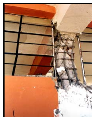
Figura 3. Falla de columna corta en un pabellón antiguo.