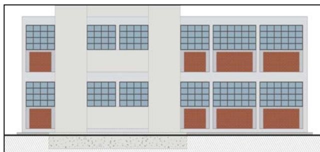
Figura 15 Sistema de Reforzamiento para edificios de dos a cuatro pisos

En algunos casos, por razones económicas, los muros de corte se tuvieron que reducir en altura o sustituir por muros de albañilería en los pisos superiores, con la consiguiente reducción del desempeño global. Sin embargo, gracias a decisiones como ésta, es que fue posible reforzar muchos edificios para los cuales la intervención se habría reducido a simples reparaciones de acabados e instalaciones.